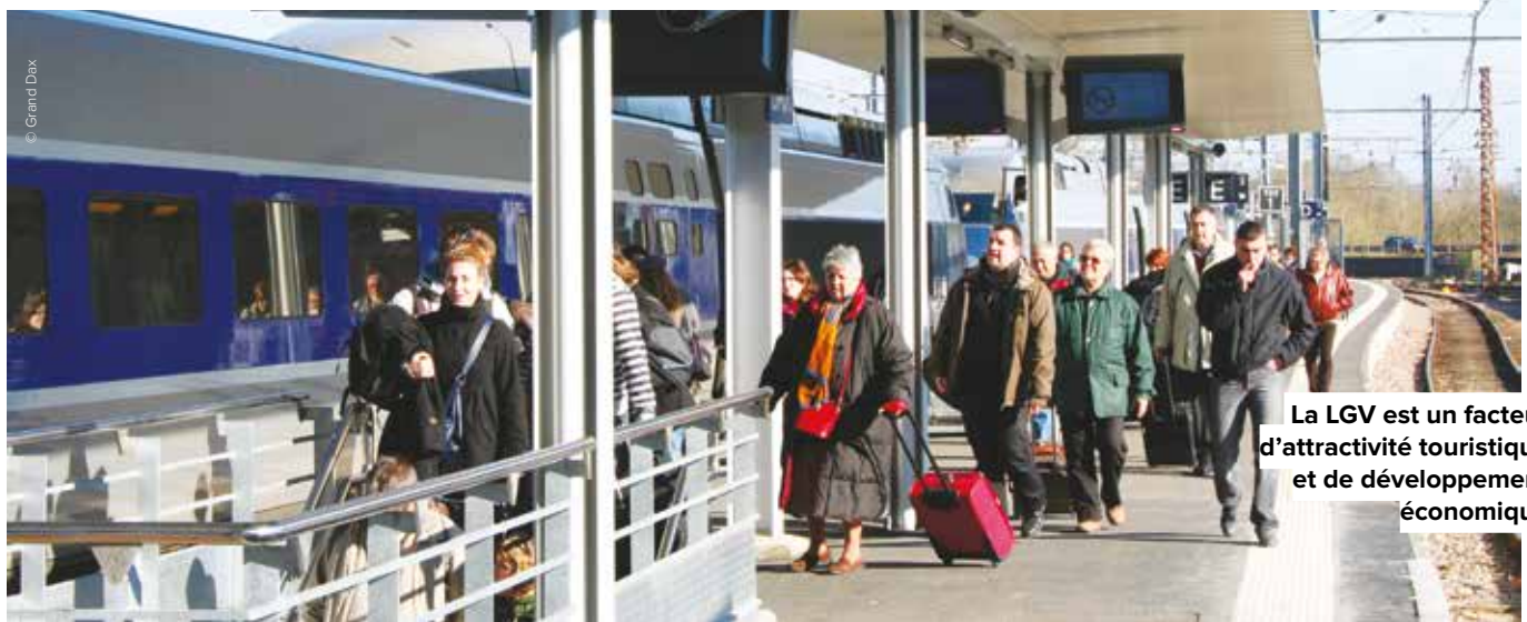
La LGV est un facteur d'attractivité touristique et de développement économique

ALORS QUE DANS UN SONDAGE , les habitants de la région plébiscitent la LGV au sud de Bordeaux, un rapport remis au gouvernement préconise de la repousser à plus de vingt ans. Inacceptable pour une grande majorité d'élus landais, qui souhaite une mobilisation unitaire.