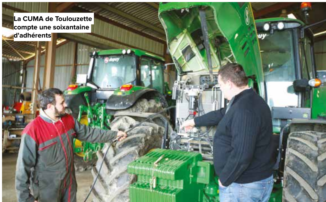
La CUMA de Toulouzette compte une soixantaine d'adhérents

pour organiser le travail et l'entraide, tel est le principe des Coopératives d'utilisation du matériel agricole, un pan méconnu de l'ESS. Exemple à la CUMA de Toulouzette qui fête ses 60 ans.