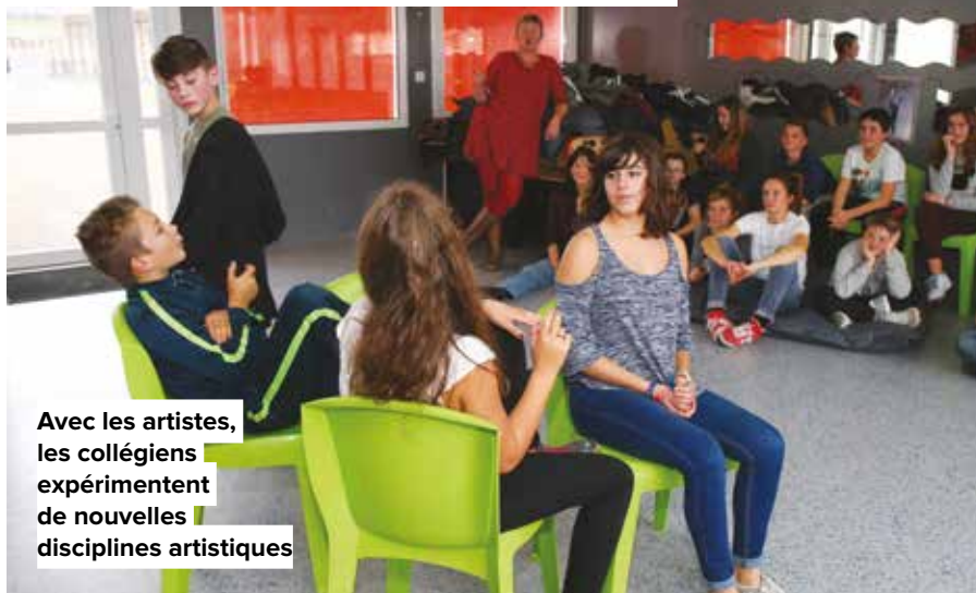
Avec les artistes, les collégiens expérimentent de nouvelles disciplines artistiques