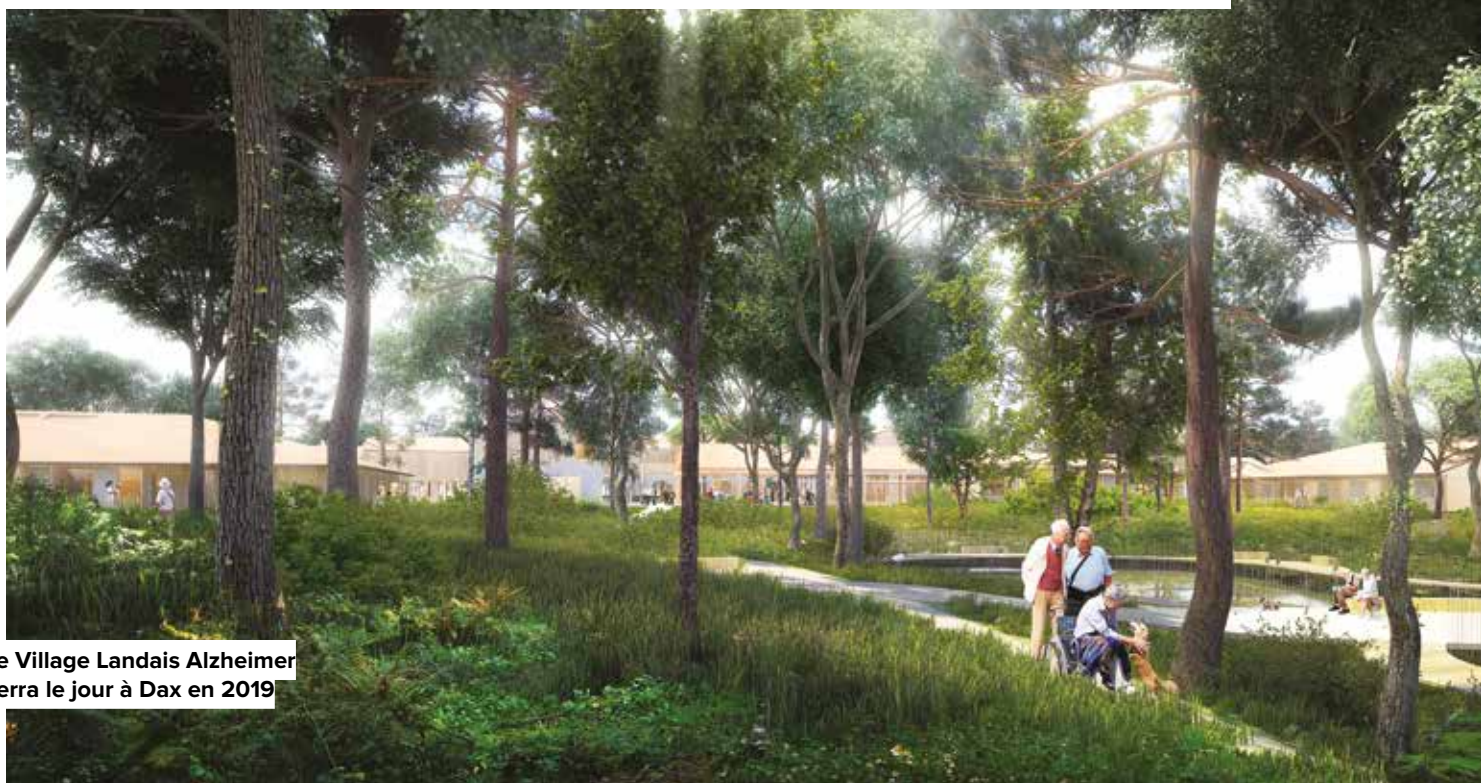
Le Village Landais Alzheimer verra le jour à Dax en 2019

P our son premier débat d'orientations budgétaires en tant que président du Conseil départemental, Xavier Fortinon a présenté un rapport dans la continuité de la politique menée par Henri Emmanuelli, avec l'objectif d'améliorer l'attractivité du territoire, stimuler l'emploi, renforcer la solidarité et réduire les inégalités. Dans un contexte national d'inquiétudes sur l'avenir des dotations, ce budget de 478 millions d'euros (-0,9 % vu le transfert de compétence Transports à la région) se caractérise par la maîtrise des dépenses de fonctionnement (368 M€, -1,2 %) et par un haut niveau d'investissement à 110 M€, équivalent à l'an passé. « C'est à travers des innovations et projets structurants qu'on continuera à rendre ce département attractif »,