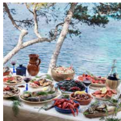
Le Soleil des Scorta Laurent Gaudé