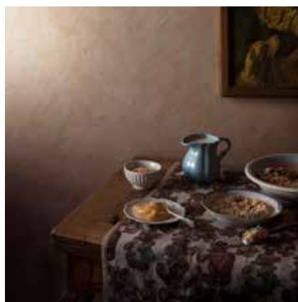
Boucle d'or et les Trois Ours Jacob et Wilhelm Grimm