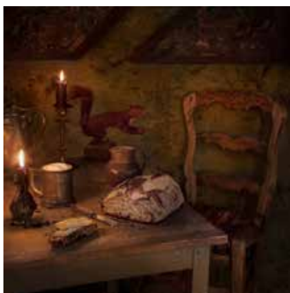
Les Misérables - Victor Hugo

sur la photo représentant une scène du livre Alice au pays des merveilles ou du sang sur la fourchette du dîner de Vipère au poing . Les amoureux de littérature s'amuseront à repérer tous ces rappels aux œuvres littéraires. Convaincu que les mots comme les aliments sont essentiels à l'existence humaine, Charles Roux démontre, à travers la série Fictitious Feasts , combien leur inter-pénétration dans la littérature souligne une dimension toute humaine. Les repas, en effet, répondent à des besoins physiques autant que psycho-émotionnels.