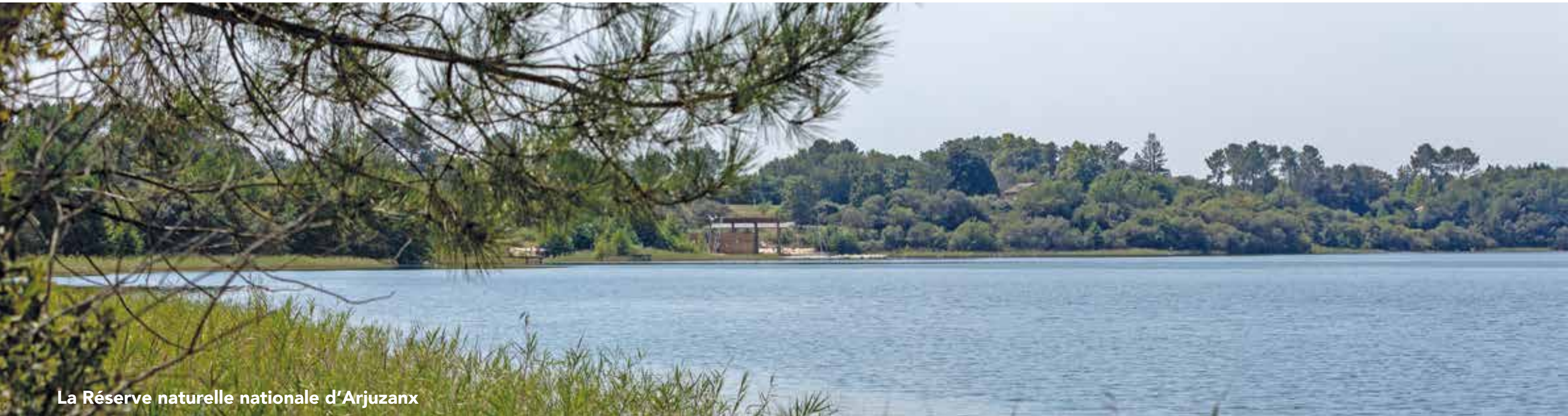
La Réserve naturelle nationale d’Arjuzanx

À l’occasion de la Journée nationale des aidants le 6 octobre, le Département des Landes lance officiellement son projet de résidence de répit et de vacances partagés aidants-aidés. En préparation et négociation avec l’État depuis 2022, ce projet à forte utilité sociale entre à présent dans une phase plus opérationnelle depuis l’accord obtenu de l’État pour son financement. Grâce à la mobilisation des élus landais et des associations partenaires, le bulletin officiel du ministère du Travail, de la Santé et des Solidarités du 28 juin 2024 a confirmé une enveloppe d’1,5 M€ pour le fonctionnement de la résidence. Cet établissement sera préfigurateur d’une offre nouvelle combinant une offre hôtelière et de tourisme de qualité et un accompagnement médico-social in situ 24 h/24 et 7 j/7. Il proposera des séjours partagés pour des aidants familiaux et leur proche en situation de handicap ou âgé en perte d’autonomie.