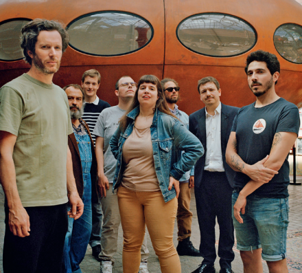
I Membres du groupe Astérotypie