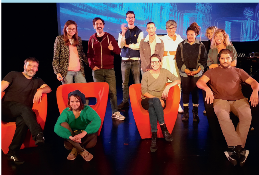
Les comédiens de la Cie L'été des sauvages et des personnes avec TSA lors d'une résidence d'artistes

Cette nouvelle édition offre, comme l'an dernier, la possibilité de découvrir un spectacle grâce au partenariat avec le Théâtre de Gascogne. La pièce de théâtre Oublier le bruit du frigo , intégrée dans la programmation de la saison culturelle de l'agglomération du Marsan, sera interprétée par la Compagnie L'été des sauvages au Théâtre du Pégly.